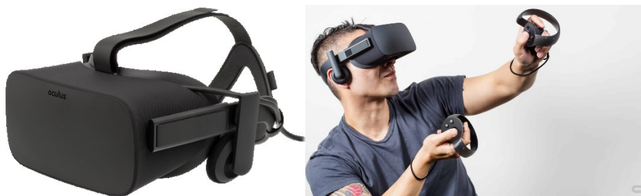
Slika 3: VR izhodna naprava Oculus Rift HMD

Oculus Rift so virtualna očala, ki jih je razvil in izdelal Oculus VR, katerega lastnik je Facebook Inc ., Oculus obvladuje naglavni oči. Oculus Rift runtime uradno podpira Microsoft Windows, macOS, in GNU / Linux.