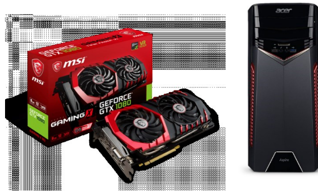
Slika 4: Graphical card and strong computer for VR