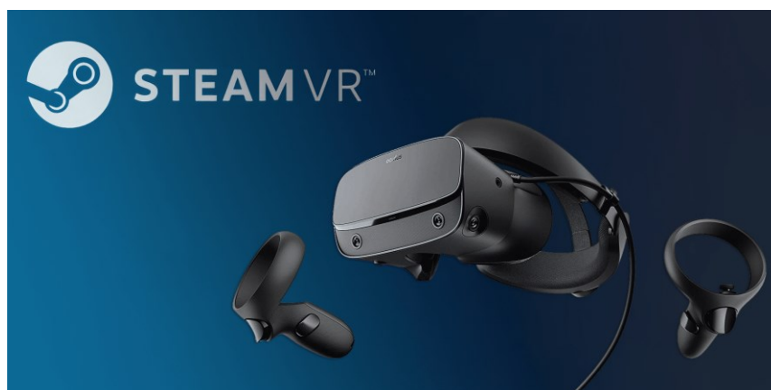
Slika 5: STEAM VR programska oprema

Trenutno obstajata dve vodilni komercialni platformi na trgu: OCULUS in HTC VIVE (STEAM VR). Obe platformi ponujata aplikacije, igre in druge izkušnje navidezne resničnosti (brezplačno in nakup). Platforme se dnevno posodabljaajo z novimi posodobitvami in popravki strojne opreme (strojne opreme) in popravki napak. Aplikacije navidezne resničnosti običajno zahtevajo veliko prostora na disku (PRIBL. 20-30 gb). Poznamo tudi druge nekomercialne platforme VR.