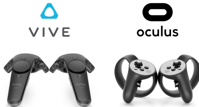
Slika 2: Vhodna naprava HTC Vive in Oculus Rift – primer ročnih kontrolk

Vhodne naprave uporabnikom omogočajo povratne informacije in določajo, kako uporabnik komunicira z računalnikom. Uporabnikom pomaga pri krmarjenju in interakciji znotraj okolja VR, da bi bilo le to čim bolj intuitivno in naravno. Najpogosteje se uporabljajo vhodne naprave kot so igralne palice, sledilne kroglice, krmilne palice, haptične rokavice, sledilne ploščice, haptične obleke, tekalne steze in gibalne platforme (virtualni omni).